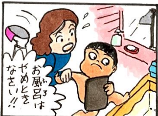
こんな思ひは端末も嬉しいでしょうね(笑)