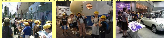
2年生町たんけん 3年生鉄道博物館 5年生藍染・自動車工場

子ども達が校外学習を行い、学校の中だけでは学べない発見や体験をしました。生活科や社会科では写真や資料で学習を進めますが、本物のもつ魅力や迫力に子ども達の目が輝いていました。見学のサポートや事前準備等へのご協力に感謝いたします。