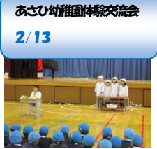
あさひ幼稚園体験交流会 2/13

吉川消防署の方をお招きし、消火の仕方について学びました。6年生は消火訓練も行いました。