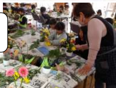
放課後子ども教室 生け花体験