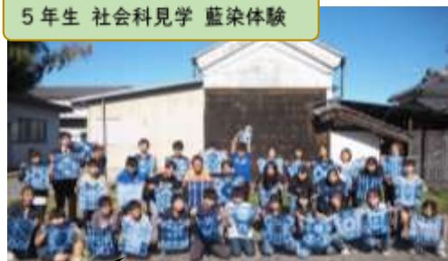
5年生 社会科見学 藍染体験