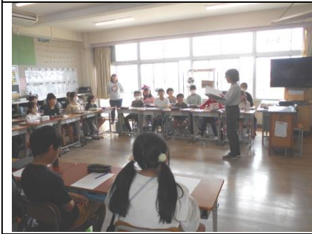
校長先生による道徳のオリエンテーション（5年生）