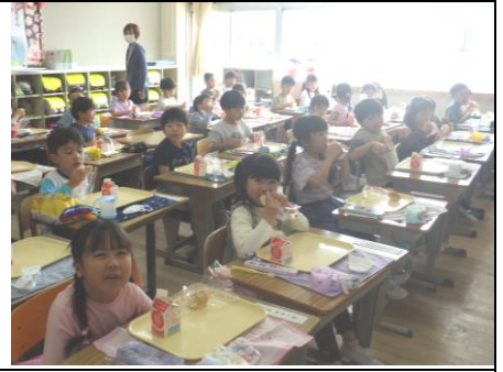
はじめての給食（1年生）