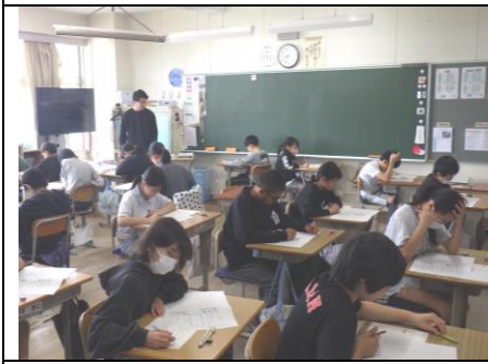
全国学力・学習状況調査（6年生）