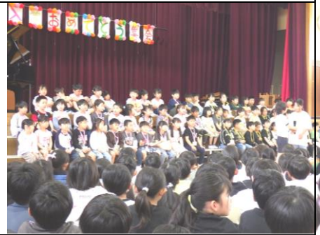
入学おめでとう集会