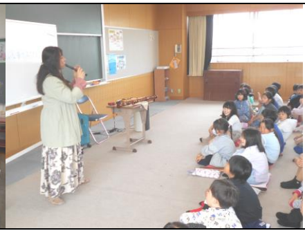
リコーダー講習会（3年生）