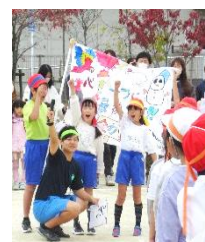
【3年生リレーと大玉送り】

今年度よりそれぞれの学年の体力課題(握力、50m走、ボール投げ等)の解決と運動好きな児童を育成し、心身ともに健康な児童を育てていくために体力向上公開日を設定しました。実行委員を中心に先生と内容を工夫して取り組んでいる様子等を保護者の方々に見てもらえて、子どもたちは嬉しかった様子でした。応援して下さった保護者の皆様ありがとうございました。今後も子どもたちと創意工夫し、心身ともに健康な児童を育ててまいります。