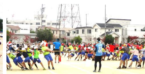
【5年生リレーとお助け綱引き】

※残りの1・2・6年の体力公開日は、1年…12月11日(木)、2年…12月16日(火)、6年…1月26日(月)を予定しておりますが、天候等により日時を変更することがあります。その際は、H&Sで連絡をさせていただきますので、確認していただきますようお願いいたします。また、今回の公開は写真・動画等の撮影は禁止しています。ご協力お願いします。